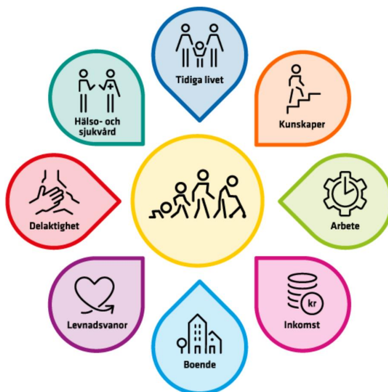
Figur 2. Åtta målområden för en god och jämlik hälsa (Illustration: Folkhälsomyndigheten)

Folkhälsopolitiken utgör sammantaget en tydlig riktning och bild över det gemensamma ansvaret för folkhälsoarbete. Ramverket ger också stöd och vägledning för hur ett lokalt folkhälsoarbete kan formas. Tillsammans med de grundläggande principerna i Agenda 2030 och de globala målen för hållbar utveckling utgör det nationella ramverket en grund för ledning och styrning av folkhälsoarbetet i Strömsunds kommun.