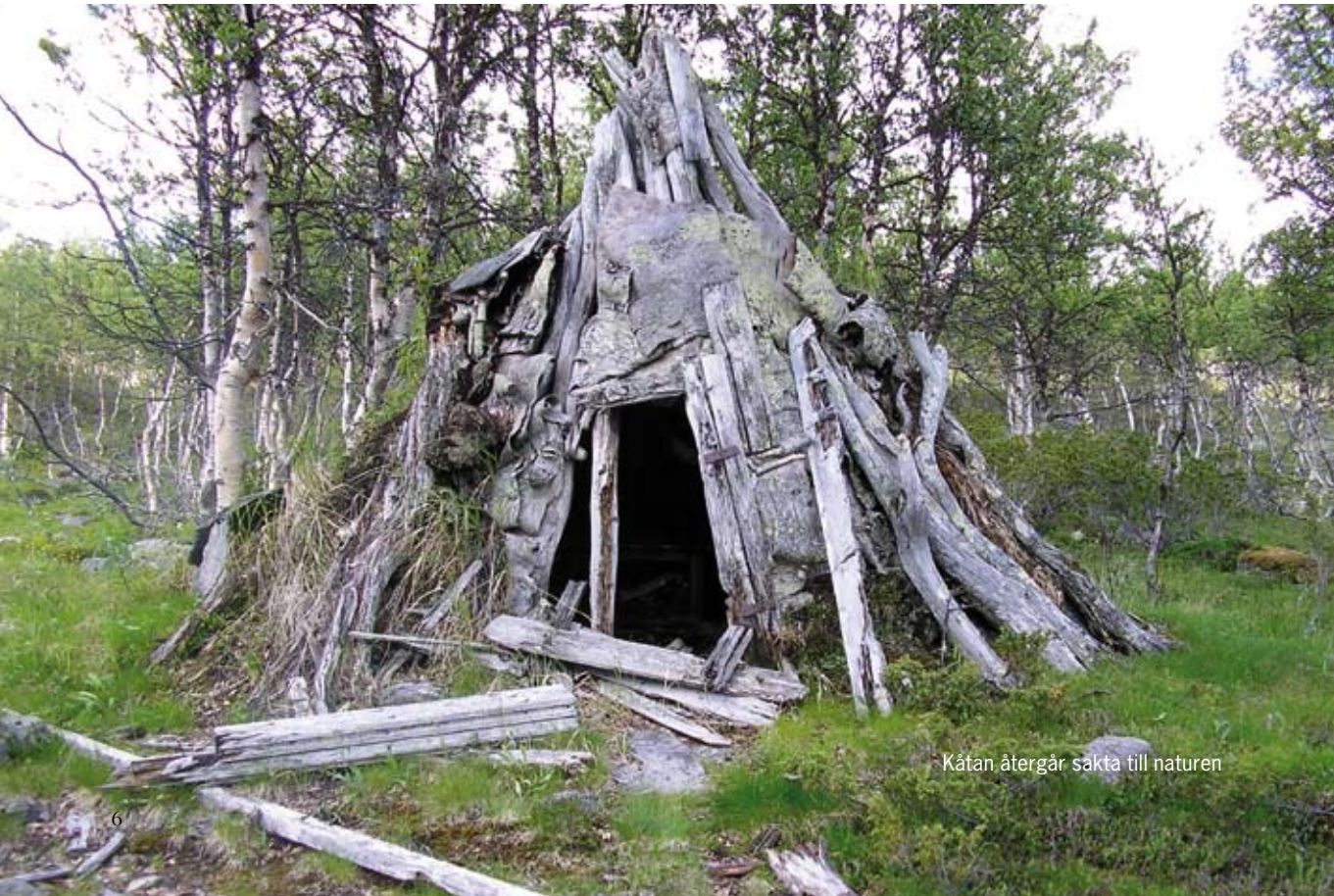
Kåtan återgår sakta till naturen

man inte lämnade några överdrivna spår efter sig. De material som användes till byggnader och redskap togs från naturen och försvinner sakta tillbaka till moder jord när de inte längre används. Det kan därför vara svårt att idag hitta spåren efter äldre samisk verksamhet. Vanliga lämningar från den intensiva renskötselns dagar är kåtatomter, härdar, renvallar, mjölkgropar, kallkällor, bengömmor och hornsamlingar.