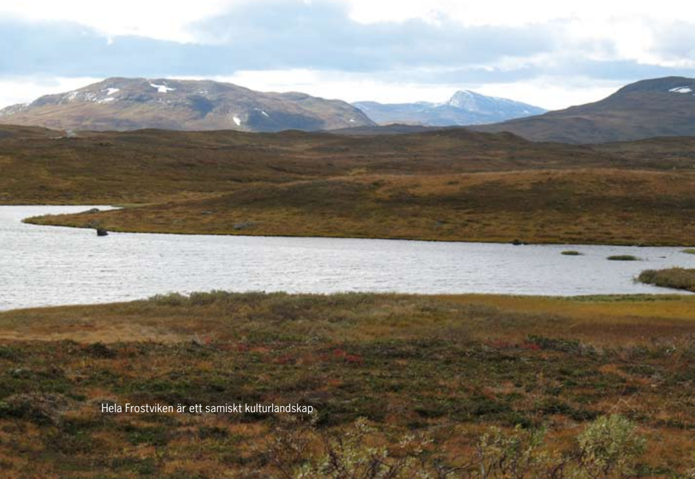
Hela Frostviken är ett samiskt kulturlandskap

DET SAMISKA SAMHÄLLET har genomgått flera stora förändringar. Från början var samerna ett fångstfolk som försörjde sig på jakt, fiske och insamling. Så småningom tämjdes vildrenar för att tjäna som lockdjur vid vildrensjakt och som drag- och lastdjur. Stegvis övergick man till intensiv tamrenskötsel med små tama renhjordar och mjölkning av renkorna. Nya arkeologiska undersökningar från Njaarke sameby i nordvästra Jämtland visar att tamrenskötsel har bedrivits åtminstone från 1000-talet e. Kr. Förhållandena bör ha varit lika i övriga delar av det sydsamiska området. Tamrenskötseln var mest utbredd från 1600- till slutet av 1800-talet. Under första delen av 1900-talet övergavs tamrenskötseln allteftersom och ersattes av dagens extensiva storskaliga renskötsel med köttproduktion i centrum. Samer har även försörjt sig som nybyggare, fiskare med mera. Idag lever de flesta samer i tätorter och har helt andra yrken än renskötarens.