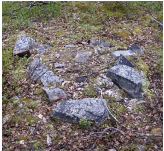
Eldstad från kåta

Skattefjällssystemet upphörde när den första renbeteslagen inrättades 1886 (i Jämtlands län trädde lagen i kraft först 1889). Istället för att som tidigare personligen ha skattat för och nyttjat ett markområde skulle samerna nu bedriva renskötsel kollektivt inom lappbyar (senare samebyar). De fem skattefjällen i Frostviken slogs samman till en enda stor lappby som kallades Frostvikens lappby. Några år senare delades området upp i tre lappbyar, Frostvikens norra-, mellersta- och södra lappbyar. Idag heter samebyarna Frostvikens norra sameby, Ohredahke (tidigare Frostviken mellersta) och Raedtievaerie (tidigare Frostviken södra).