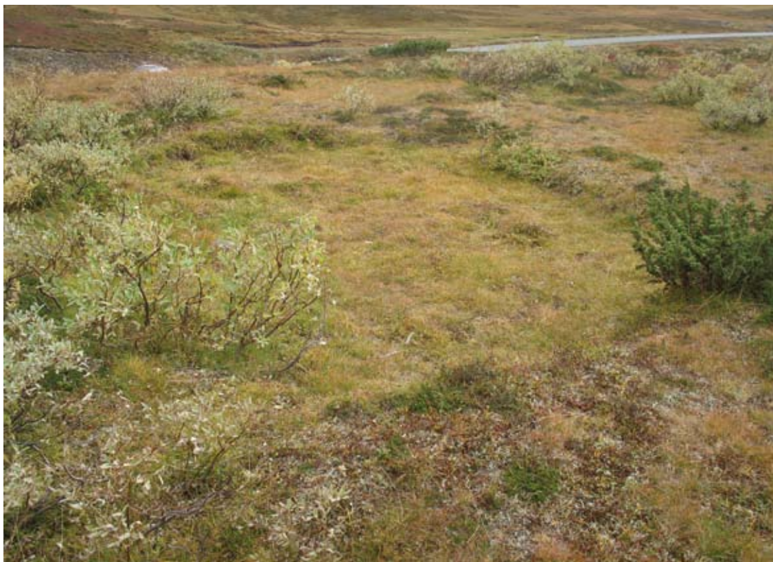
Stalotomt intill Stekenjokkvägen

I Hamptjärnsområdet finns tomterna grupperade på två lokaler. Fem tomter ligger