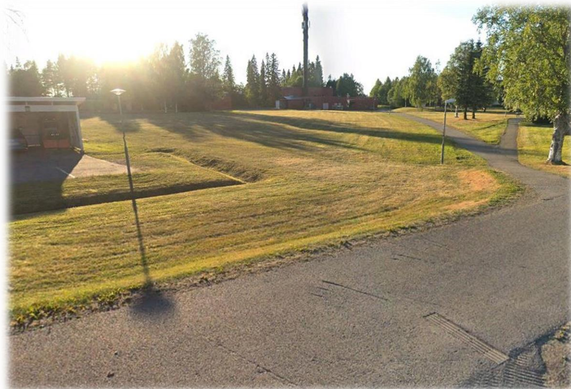
Foto från Europaväg 45 mot nordväst.

Planområdet ligger i norra delen av Strömsunds samhälle, som begränsas av ett parkområde och fjärrvärmeverk i öst, Strömsunds hälsocentral i söder, Strömbacka/Granbacken i norr och Europaväg 45 (E45) i öst.