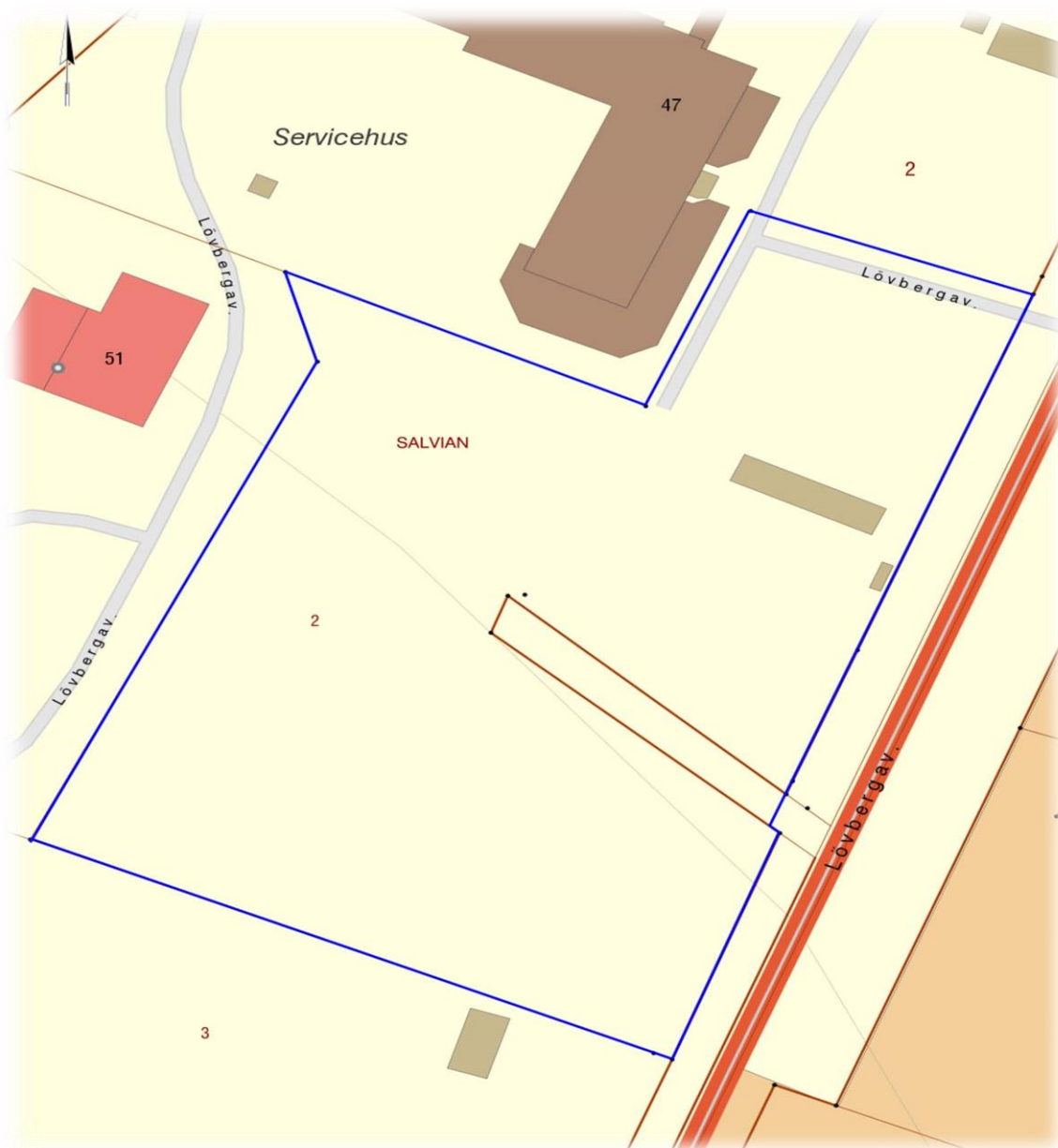
Utdrag ur fastighetskartan. Planområdet är markerat med blått.