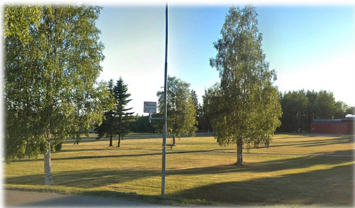
Foto från Europaväg 45 mot sydväst.