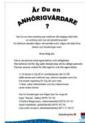
Inbjudan till samtalsgrupp

Telefonlista vård- och socialförvaltning, Närvård Frostviken